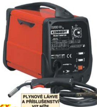
PLYNOVÉ LÁHVE A PŘÍSLUŠENSTVÍ VIZ NÍŽE

Výstupní rozsah 50 A-120 A (DC). Výkonná jednofázová svářečka, která pracuje na napětí z běžné síťové zásuvky 240 V. Automatické ovládání rychlosti posuvu drátu s manuálním nastavením. Profesionální hořák s napájením a přívodem ochranného plynu ovládaným spouští zabráňuje nežádoucímu vzniku oblouku a zbytečné ztrátě proudu. Provoz při nízkém proudu - zdroj je schopný vyvinout výstupní proud 50 A pro snadné svařování tenkých materiálů. Velikost cívk s crátem je variabilní - pro maximální mobilitu a hospodárnost je možno použít cívkou o hmotnosti 0,7 kg i o hmotnosti 5 kg. Robustní nově konstruovaná skříň je lehká a mobilní. Svářečka lze použít pro svařování s tavidlem (bez ochranného plynu) a svařování Mig/Mag (s ochranným plynem). Dodáváme s 2-válcovou podávací jednotkou s klidným chodem, dále s příslušenstvím, integrovanou rukojetí a síťovým kabelem o délce 2 m. Svářečka je vhodná pro automobilový průmysl, zemědělství, údržbu a stavebnictví. Odpovídá TUV-GS, GOST, EMC, LVD a všem platným normám CE. Třída izolace H. Krytí IP21.